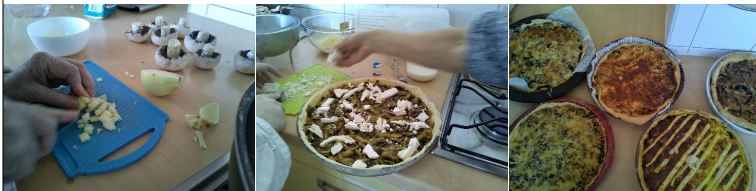
Photos prises lors de la séance

Réalisée avec les élèves du lycée Nermont de Nogent-le-Rotrou le 07/02/2023